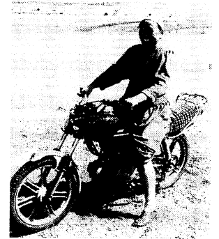
バイクに乗った少女